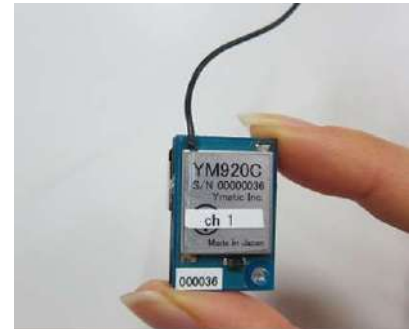
センサケーブルを接続した場合